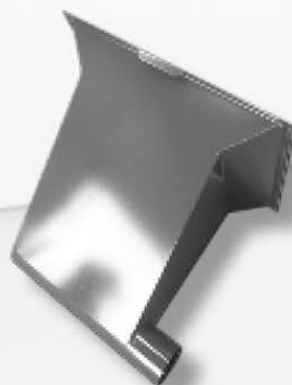
Anschluß für Zentralabsaugung