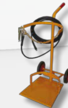
Transportwagen für Behälter 110 l