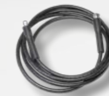
Schlauch für Sprühpistole