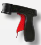
Aufsatz für Dose